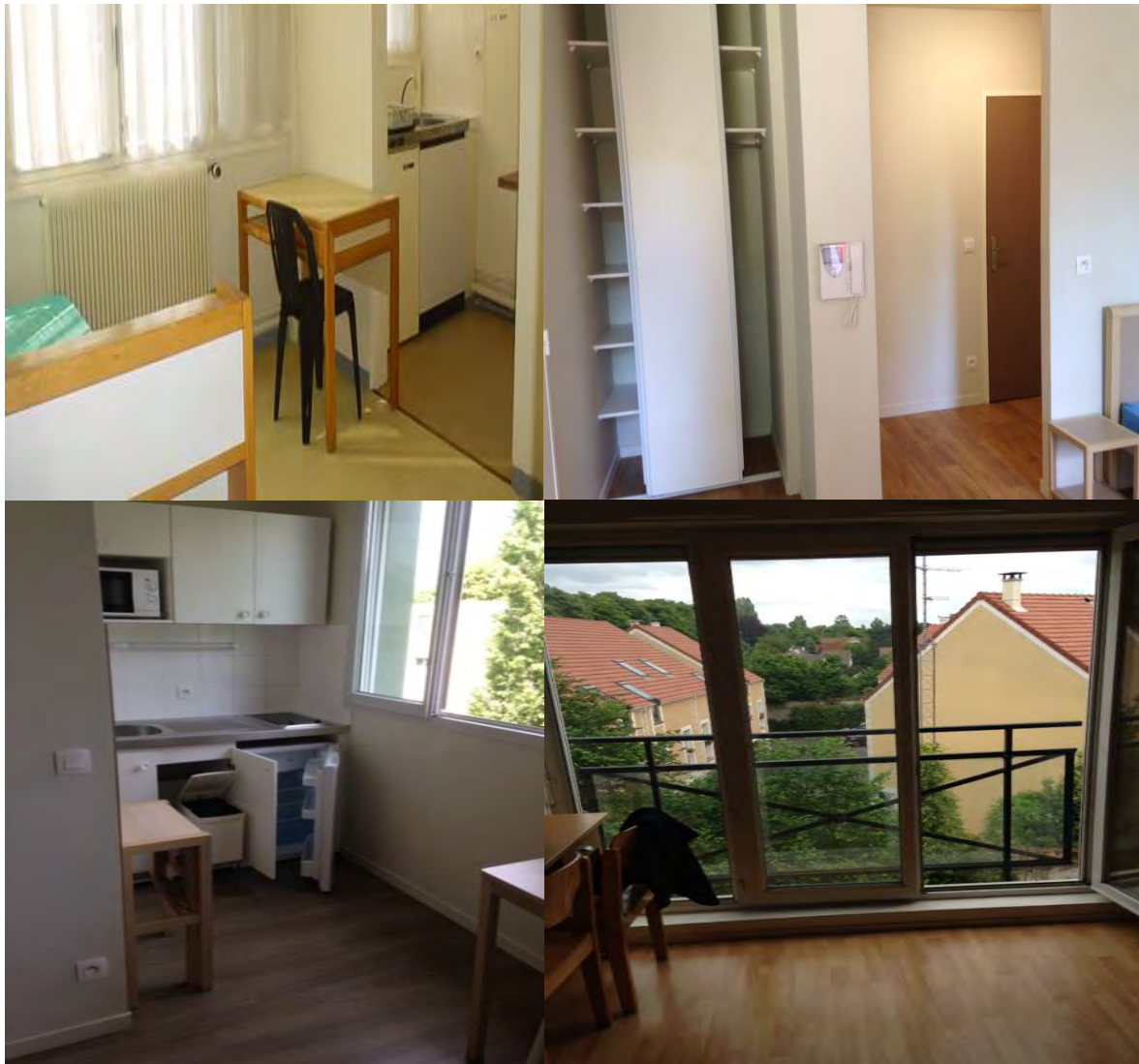
Exemples de logements proposés

La location meublée doit porter sur un logement muni de tout le mobilier nécessaire à l'habitation. Cette modalité de location est encadrée par la loi Alur de mars 2014. Ces logements permettent à de jeunes actifs âgés de 18 à 30 ans (voire au-delà) de louer des studios et des T2 meublés en région parisienne. Le montant mensuel des loyers s'élève de 450 à 600 € toutes charges comprises (eau, chauffage, ...).